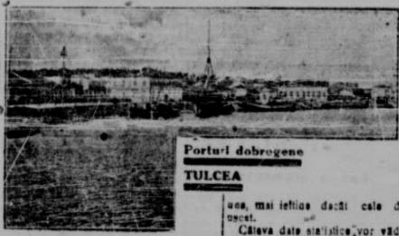
Portul dobrogea TULCEA

Statul care știe să asigure acestor drumuri organizații, minimum de siguranță și de folos